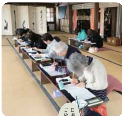
日頃の喧騒を離れ、こゆるりと

柳川藩初代藩主立花宗茂公の実父高橋紹運公の菩提寺「天叟寺」さん。紹運公は、戦国時代末期、大友と立花両家のため、筑前岩屋城で島津の大軍を相手に不屈の闘志で戦い、城兵共々玉砕した信義の闘将。立花家ゆかりの禅寺で坐禅をし、写経をしていただきます。そのあとは、お抹茶とお菓子をいただきます。心落ち着けるひと時をお過ごしください。*防寒着をお持ちください。 *坐禅時は、裸足になります。*ヘルトのない動きやすいズボン(スカート、ジーンズは不可)などでお越しください。