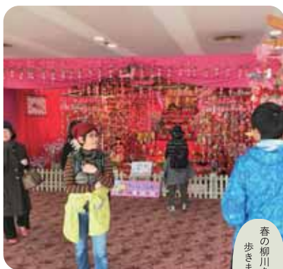
春の柳川を健康的に歩きましょう

*タオルをお持ちください。*動きやすい服装と靴でお越しください。*予約の際に希望のコースを選択ください。