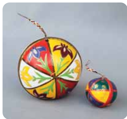
思い思いの色を付けてみませんか