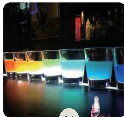
素敵な夜を過ごしましょう

*未成年の方はご参加できません。 *お酒を飲まれる方は車でのご参加は、ご遠慮ください。