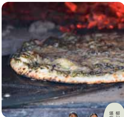
柳川の恵みを堪能しましょう

*小学生以下は要保護者同伴(大人一人に子ども一人)。*エプロンをお持ちください。