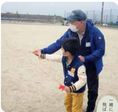
一緒に紙ヒコークキを飛ばしましょう