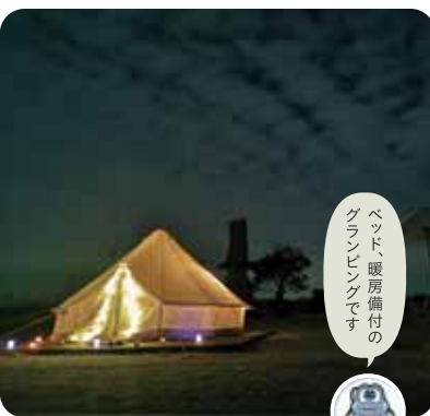
ベッド、暖房備付のグランピングです

普段より豪華で、手軽に楽しめるグランピングを柳川で体験。日中に有明海の海水で作る「塩づくり体験」で独自の塩を作ります。夕食は地元野菜と博多和牛のバーベキューを楽しみ、夜は満天の星空の下、グランピングテントでのんびりと過ごします。朝食は地元のお米を用意しますので、前日に作った塩を使っておにぎりを作ってみましょう。*雨天中止。*小さいお子様が多い、4名以上などの場合はご相談ください。*持ち込みは自由(事前にお問い合わせください)。*お支払いは、前払いになります。