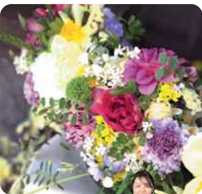
お花に癒されるひとときを

*小学5年生以上から参加できます。*防寒具 花用ハサミ(お持ちであれば)、飾りたい場所の写真(イメージ図でも可)をお持ちください。 *雨天時は「杉原邸」室内にて開催。