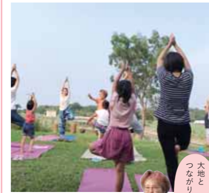
大地と つながりましょう

柳川の自然を五感で味わいながらヨガをすることができ「yoga shala あうん」さん。今回は、裸足で大地を感じる「yoga shala あうん」さん。今回は、裸足で大地を感じながら行う「アーシングヨガ」も実施いたします(雨時は室内でヨガ)。開放的な空間でヨガをした後は、柳川産食材を使用したプチデザートいただきます。日頃の疲れを癒やしましょう。男女問わず、初心者の方も大歓迎です。*動きやすい服装で、タオルをお持ちください。*お支払いは、前払いになります。