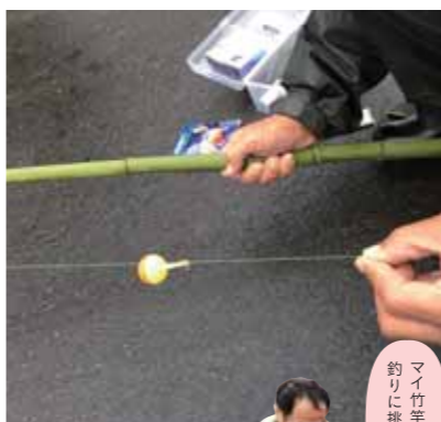
マイ竹竿で 釣りに挑戦しよう

*雨天中止。*小学生以上から参加できます。*釣った魚を持って帰りたい方は、クーラーボックスをお持ち下さい。*汚れてもいい動きやすい服装でお越しください