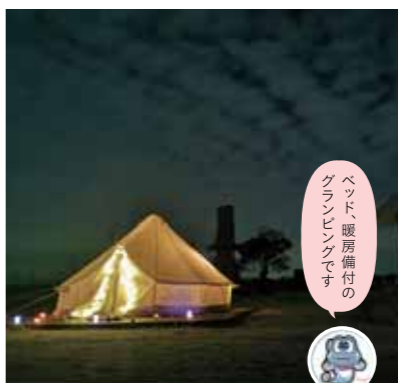
ベッド、暖房備付の グランピングです

*雨天中止。*小さいお子様が多い、4名以上などの場合はご相談ください。*持ち込みは自由(事前にお問い合わせください)。*お支払いは、前払いになります。