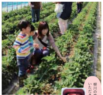
柳川の恵みをいただきます♪

柳川は、いちご農家さんも多い地域です。「あまおう」として有名ないちごは、大粒で濃い甘味が印象的です。最初にいちご畑で収穫体験をしていただきます。収穫したいちごを持って、柳川洋菓子店の老舗「ケーキのカトウ」さんでジェラート作りを体験します。柳川の自然の恵みで作った出来立てジェラートは感激の味ですよ。 *集合と解散場所が異なります。 *お車で参加できる方のみに限らせていただきます。