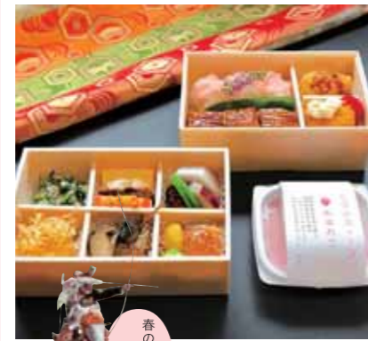
春の柳川を満喫し、 贅沢な時間を

春のゆるり旅を締めくくる流鏝馬特別観覧。今回は柳川の名店「お出汁や一伝」さんによる、地元の新鮮な食材や柳川名物うなぎを使用した「華結び弁当」をご用意します。桜を見ながらお弁当を堪能した後、神事を見学し、特別観覧席にて流鏝馬をご覧いただきます。柳川の歴史ある古布を使ったお香袋もお土産にどうぞ。*荒天中止。*防寒具をお持ちください。*三脚の使用不可。