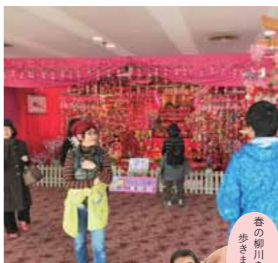
春の柳川を健康的に 歩きましょう

「柳川リハビリテーション病院」の理学療法士さんと一 緒に、さげもんめぐりで彩られた柳川の街を歩きましょう。 準備体操やストレッチを学んで、運動負荷量などを 確認しながらのウォーキングです。お買い物も楽しんで いただける短めの約4キロを歩く「ゆったりコース」と、 約6キロをしつかりと歩く「本格コース」のどちらかを 予約の際に、お選びください。 *タオルをお持ちください。*動きやすい服装と靴でお越しくだ さい。*予約の際に希望のコースを選択ください。