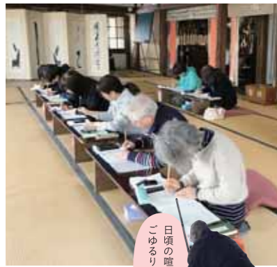
日頃の喧騒を離れ、 こゆるりと

柳川藩初代藩主立花宗茂公の実父高橋紹運公の菩提寺「天叟寺」さん。紹運公は、戦国時代末期、大友と立花両家のため、筑前岩屋城で島津の大軍を相手に不屈の闘志で戦い、城兵共々玉砕した信義の闘将。立花家ゆかりの禅寺で坐禅をし、写経をしていただきます。そのあとは、お抹茶とお菓子をいただきます。心落ち着けるひと時をお過ごしください。*防寒着をお持ちください。*坐禅時は、裸足になります。*ヘルトのない動きやすいズボン(スカート、ジーンズは不可)などでお越しください。