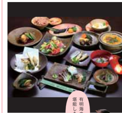
有明海の恵みを堪能しましょう

春の有明海の家産物といえば、アサリ、イソギンチャク、ムツゴロウにワラスボとたくさん。希少な有明海珍味のフルコースを食しながら、有明海の今昔を映像にて紹介、ベテラン漁師さんとも和気藹々にデザートを頂きながら楽しい会話も楽しめます。森里海連環の世界を体感くださいませ。