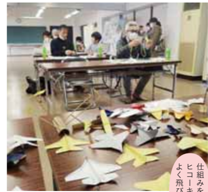
仕組みを知ると ヒコークィは よく飛びますよ