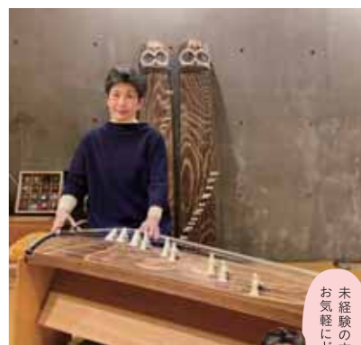
未経験の方も お気軽にどうぞ！