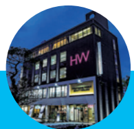
ハリウッドワールド美容専門学校

※事前に衣装をご覧になれます(要予約)。 ※実施当日に衣装を決める場合、8時開始となります。 ※お支払い方法は現金又はカードになります。 ※キャンセルの場合、3日前までにご連絡ください。